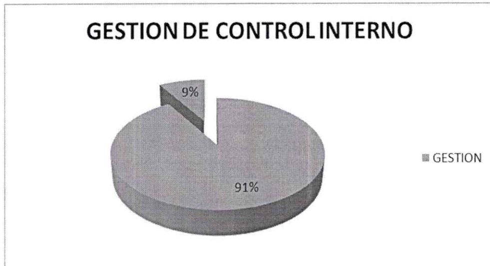
Grafico 2. Muestra la Gestión realizada por Control Interno de gestión en la vigencia 2017, desarrolló su Plan de Acción en un: 91%.

Es de aclarar que este porcentaje es global con respecto a todas las actividades que deben desarrollarse durante la vigencia 2017. De igual forma se manifiesta que la gestión se ha cumplido a cabalidad de acuerdo a los términos estipulados en los cronogramas internos y los establecidos en las normas.